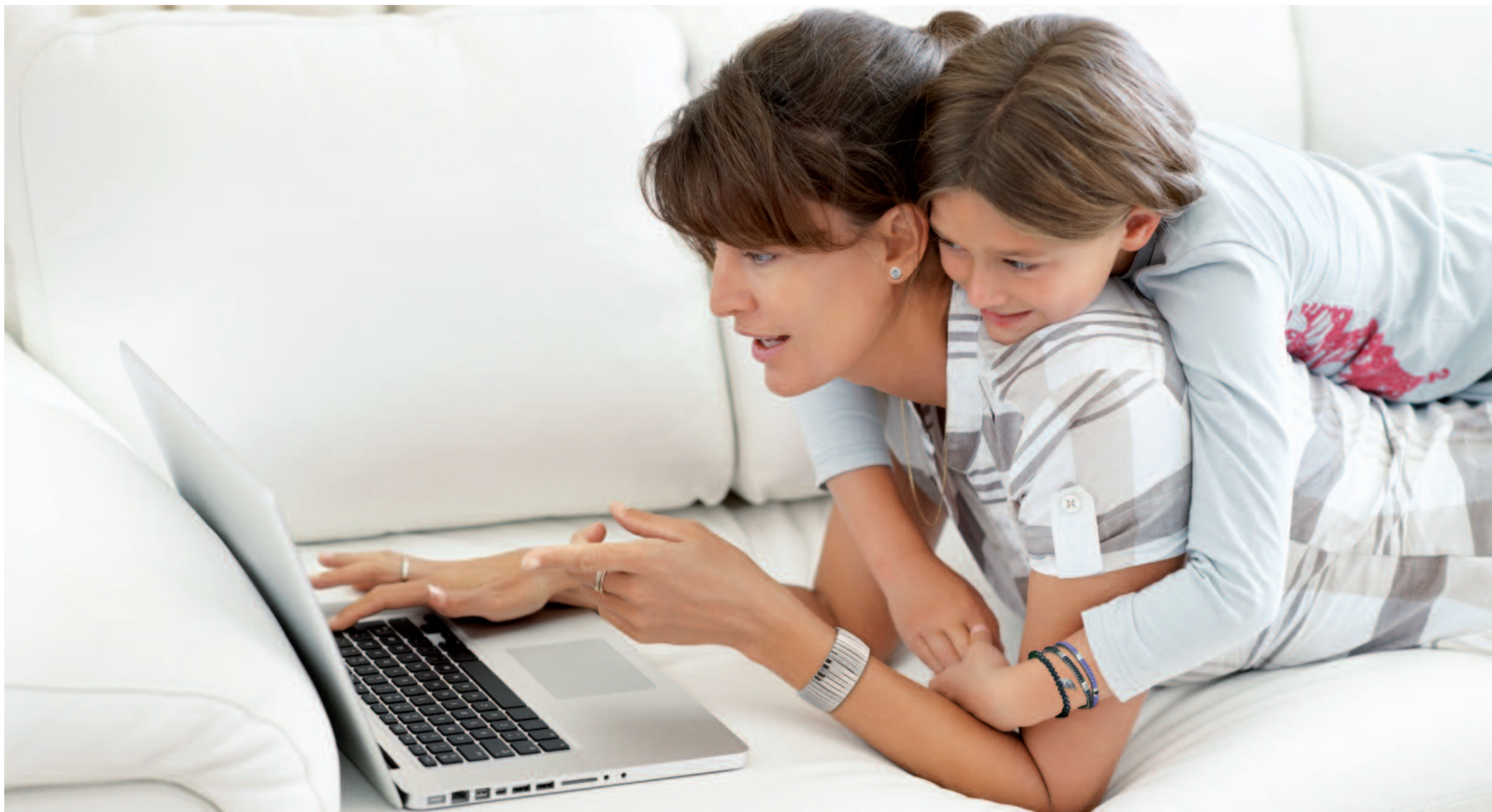
Information und Unterhaltung: FROGBLOG bietet beides.

Zu Beginn seiner neuen Dekade startet ENERGETIX Bingen einen unternehmenseigenen Blog