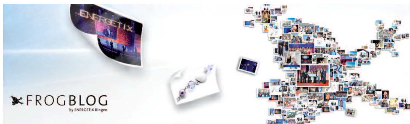
Das Unternehmenssymbol, der ENERGETIX Bingen-Frosch, begrüßt online seine Blog-Leser.

Weiterführende Informationen zum Unternehmen finden Sie unter www.energetix.tv