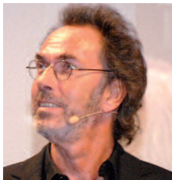
Hugo Egon Balder