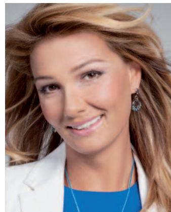
Franziska van Almsick