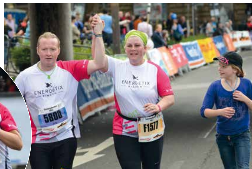
Markenbotschafter und Pacemaker Joey Kelly: „Ich bringe jeden von euch über die Ziellinie!“