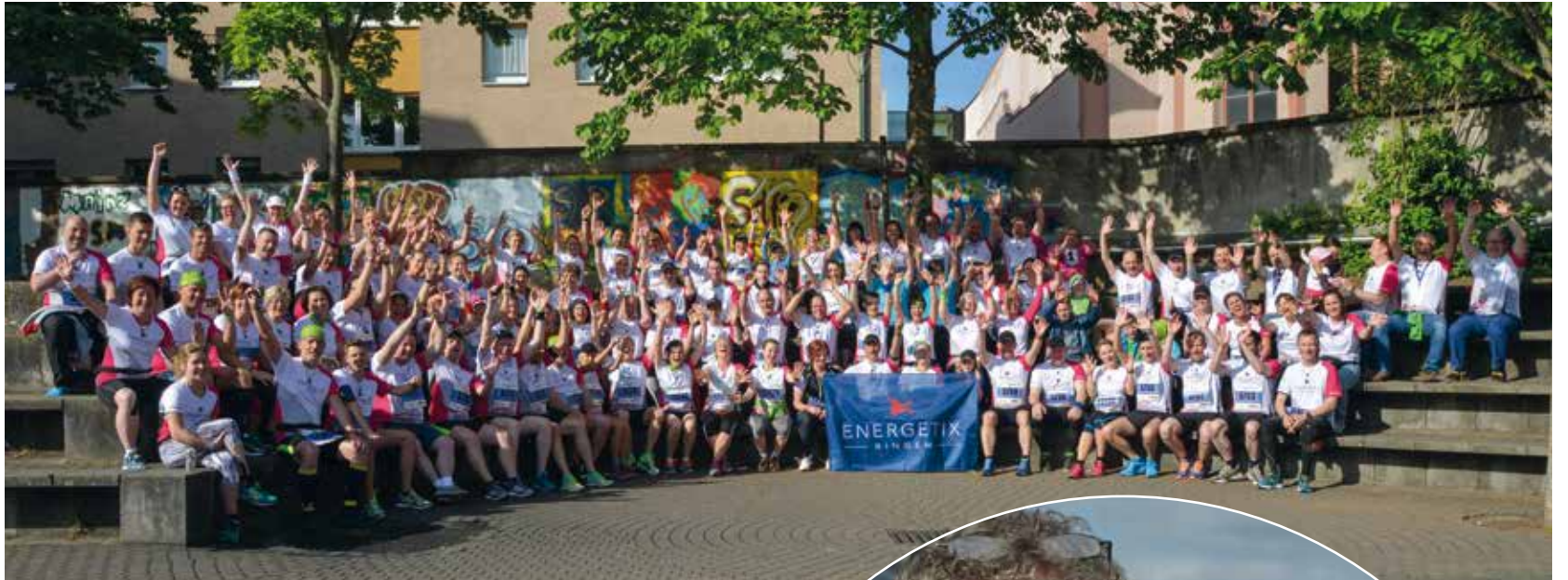
Mehr Gänsehaut geht kaum: Gruppenbild mit „Wir-Gefühl“.

samere Läufer mit dem ENERGETIX-Shirt anspornend zum Ziel zu führen. Wer jemals an einem Laufwettbewerb teilgenommen hat, weiß, welche Eigenmotivation für eine derartige sportliche Aktion erforderlich ist: für Ausnahmesportler Joey Kelly eine normale Kür nach der Pflicht, die er lächelnd mit Leichtigkeit und mit großem Dank seiner Schützlinge erfüllte. Kelly brachte tatsächlich jeden ins Ziel.